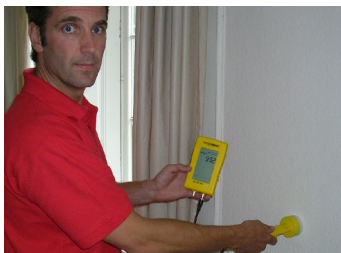
Vochtmeting vooraf met behulp van microgolven meetapparatuur