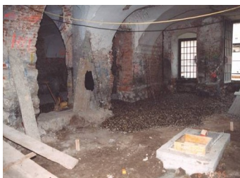
Gevolgen vochtoverlast gemeentehuis (voor)